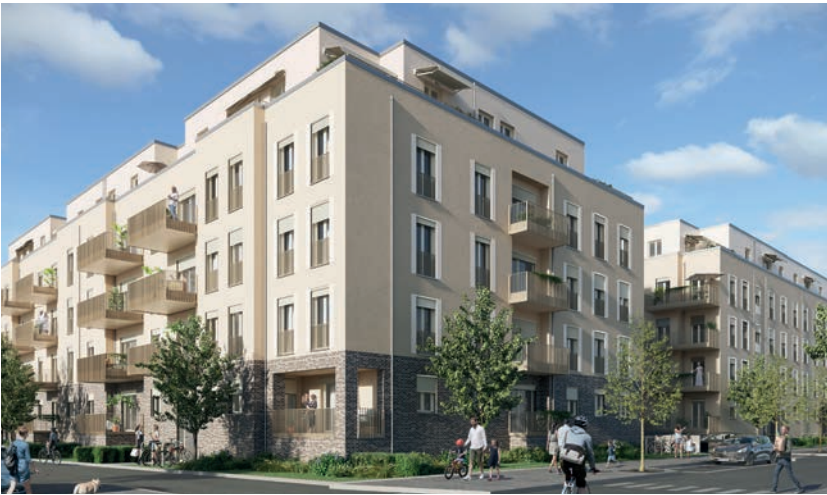
Quartiersentwicklung Marienufer, Deutsche Wohnen Gruppe