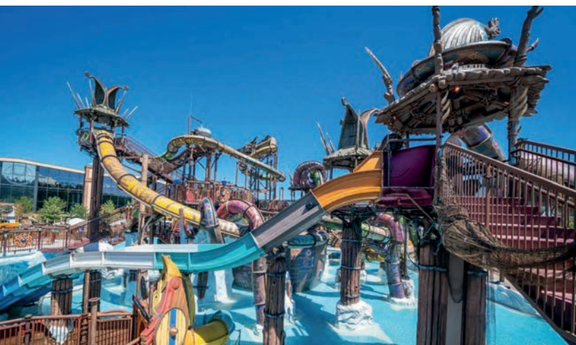
Europa-Park GmbH & Co. Mack KG