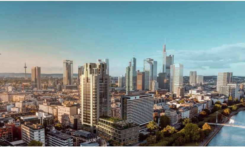
Groß & Partner