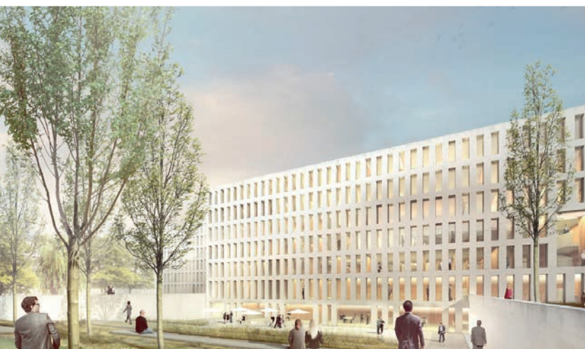
wittfoht architekten bda