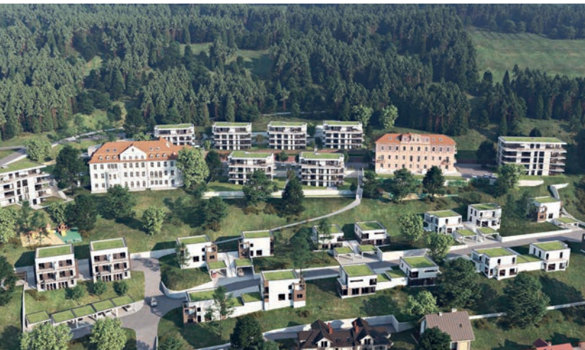
DBA Deutsche Bauwert AG