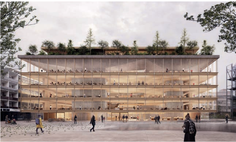
Ponnie Images, Cologne, Germany