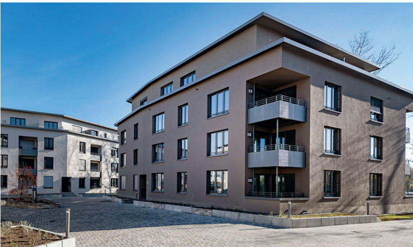
DBA Deutsche Bauwert AG