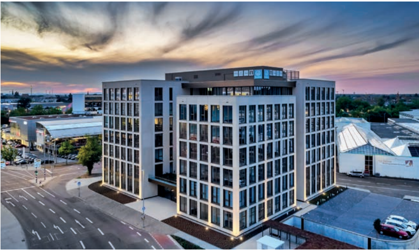
flash.iFFect Scheerschmidt & Gutmann GbR