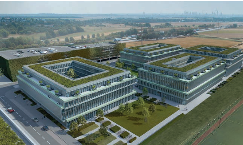
ERWE Projekt Friedrichsdorf GmbH